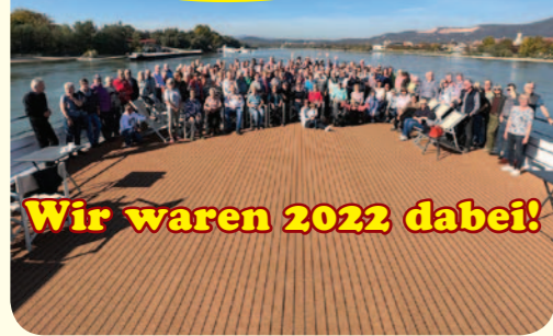
Wir waren 2022 dabei!