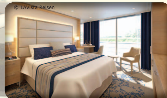
Kabinenbeispiel Oberdeck Deluxe/ Mitteldeck superior